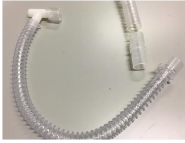
Slangenset bij gebruik op canule